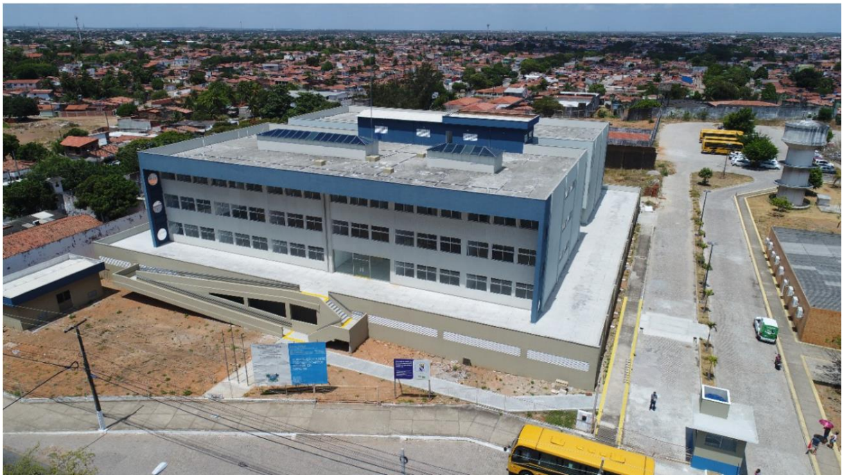
Imagem 3 - Vista aérea frontal da edificação