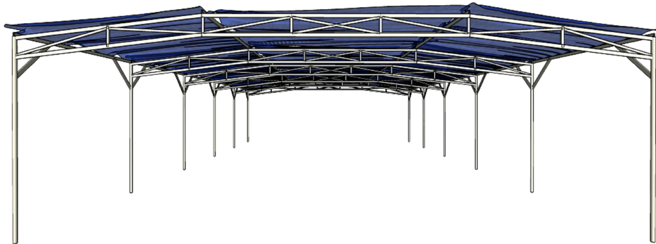
PERSPECTIVA FRONTAL COM COBERTURA SEM ESCALA